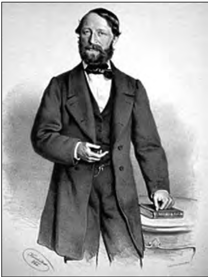
FIGURA 2. Iuliu Barasch, Litografia lui Josef Kriehuber, 1863 [13]

populară” (timp de 12 duminici, începând din nov. 1854) și care va vedea lumina tiparului în 1857. „Sunt unii oameni care desprețuiesc știința dieteticeii, care sunt într-o îndoială dacă este de trebuință și de folos ca să conservăm și să dezvoltăm știința sănătății. Sunt unii care vor să fie sănătoși, dar nu vor să jertfească nimic pentru sănătate!” (Lecțiunea a II-a) [3]. În anul 1854, a publicat „ Evreii din Moldova și Valachia. Studiu istorico-social ” în limba germană și tradus în limba română de Elias Schwarzfeld.