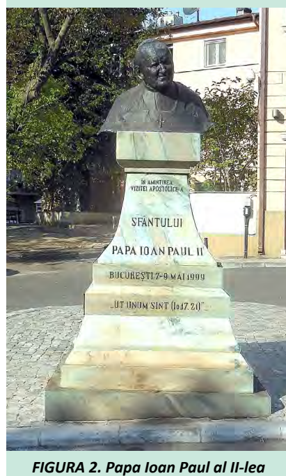
FIGURA 2. Papa Ioan Paul al II-lea