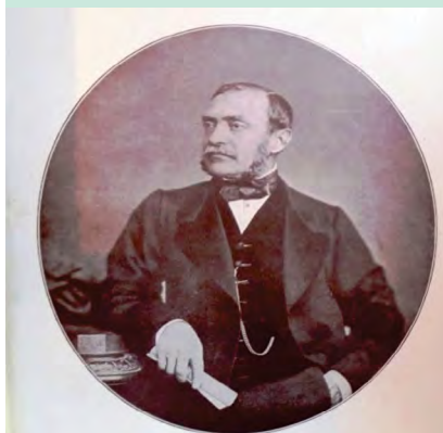
FIGURA 5. Nicolae I. Kretzulescu