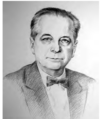
FIGURA 7. Acad. Daniel Danielopolu

Medic român, inovator în tehnica chirurgicală și instrumentală; profesor universitar la Facultatea de Medicină din București, având preocupări în domeniul chirurgiei și anatomiei, aducând contribuții în domeniul protezelor osoase, anastomozelor intestinale și rahianesteziei; Cavaler al Ordinului „Steaua României” [12].