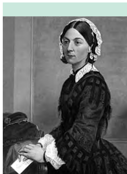
FIGURA 1. Florence Nightingale

El a stat în scaunul pontifical un număr de 27 de ani, considerat „ a fi fost unul dintre cei mai longevivi papi din istorie ”. Totodată, trebuie să știm că papa Ioan Paul al II-lea a fost și primul suveran polonez,