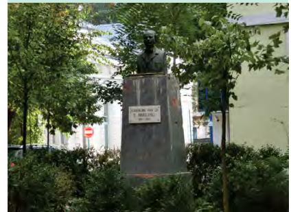
FIGURA 8. Bustul acad. Daniel Danielopolu, operă a sculptorului Ion Jalea