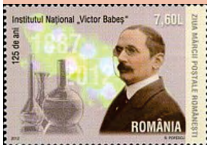
FIGURA 5. Prof. Dr. Victor Babeș (1854-1926)