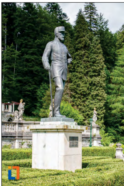
FIGURA 2. Statuia Regelui Carol I al României din Sinaia