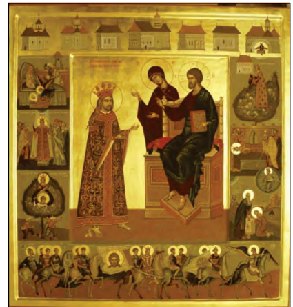
FIGURA 1. Ștefan cel Mare și Sfânt

1914, duminică 26 sept., Sinaia, Castelul Peleş (105 ani) – A decedat Regele Carol I al României (n. 1839). Ultimele zile ale Majestății Sale au