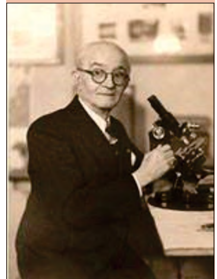
FIGURA 6. Dr. Constantin Levaditi (1874-1953)

1874, iulie 19, Galați – 145 ani de la nașterea medicului Constantin Levaditi (†1953, sept. 5, Paris) A fost unul dintre fondatorii inframicrobiologiei moderne, român naturalizat în Franța, membru corespondent al Academiei Române (1910) și membru de onoare (1926); a urmat liceul la București, apoi Facultatea de medicină din București (1898); specializarea a făcut-o la Paris, în Laboratorul de Patologie Generală și Experimentală al Institutului „Pasteur” (1898-1900) și apoi la Frankfurt-am-Main, în Institutul de Terapie Experimentală (1900-1901); a obținut doctoratul în medicină al Facultății din Paris (1902), continuându-și cercetările la Institutul „Pasteur” și la Institutul „Fournier” (1902-1905); profesor la Facultatea de Medicină din Cluj (1919-1920); a primit marele premiu „Pasteur” (1922, Strasbourg); profesor la Facultățile de Medicină din Madrid și Barcelona,