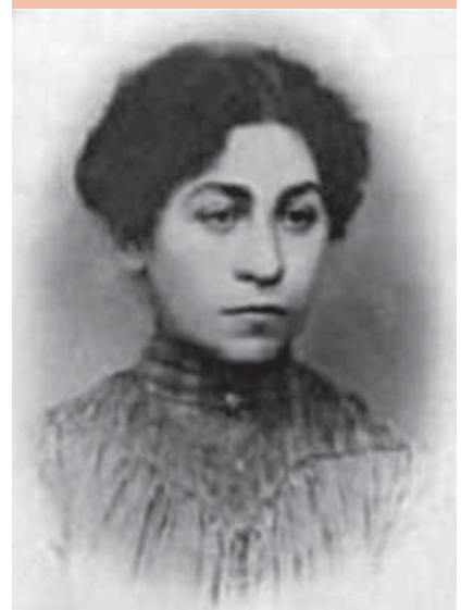
FIGURA 7. Ștefania Mărăcineanu (1882-1944)