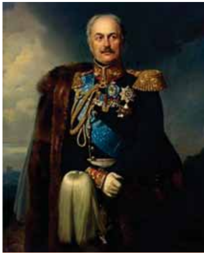
FIGURA 3. Gen. Pavel Kiseleff (1788-1872), portret de Franz Krüger, 1851