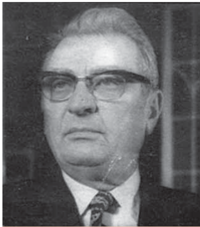
FIGURA 8. Dr. Aurel Baranga (1913-1979)

Dramaturg de succes cu piesele: „Mielul turbat“ (1954; 1963); „Arcul de triumf“ (1955); „Siciliana“ (1961); „Fii cuminte, Cristofor!“ (1965); „Sf. Mitică Blajinul“ (1966) ș.a.; absolvent al Facultății de medicină din București (1938); incinerat.