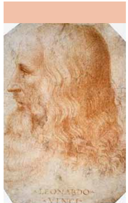
FIGURA 1. Leonardo da Vinci (1452-1519), portret de Francesco Melzi