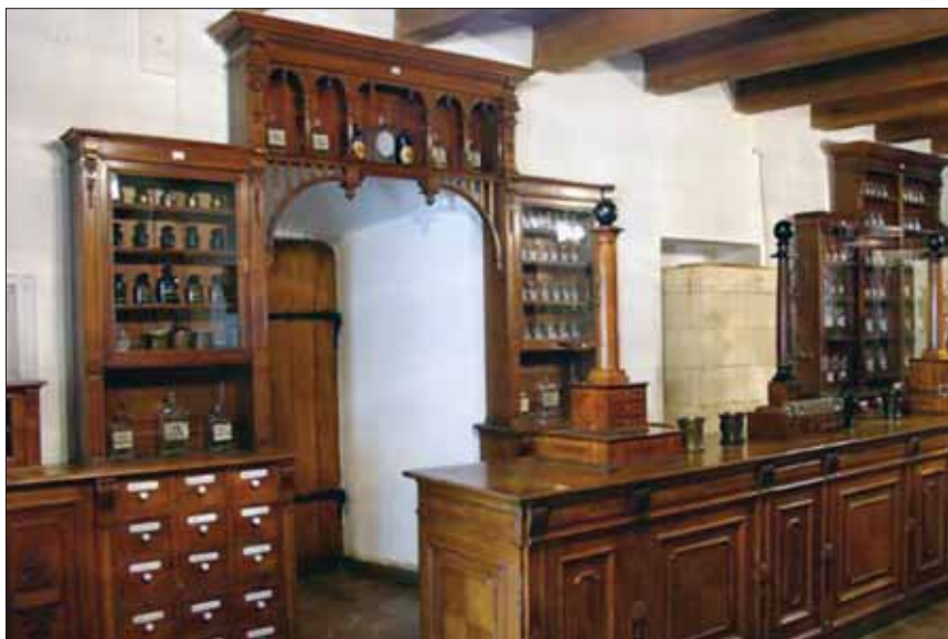
© Muzeul Național Bruckenthal, Sibiu ( www.bruckenthalmuseum.ro )